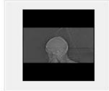
2 Topogram 1.0 T20s [INTERNE] 11:34:43 (image 1 de 1)