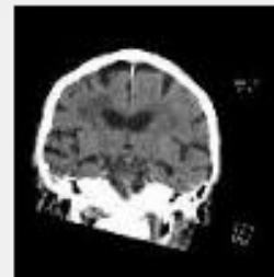
603 CORO [INTERNE] 11:40:44 (66 images)