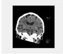
603 CORO [INTERNE] 11:40:44 (66 images)