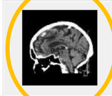
604 SAG [INTERNE] 11:41:05 (51 images)