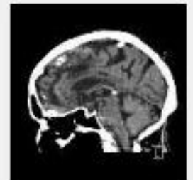
604 SAG [INTERNE] 11:41:05 (51 images)