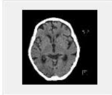
602 TRANS [INTERNE] 11:40:15 (59 images)